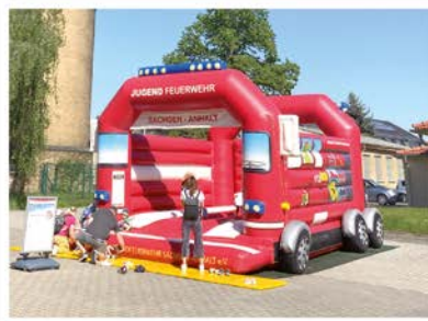
10:00 - 16:00 Uhr Tag der offenen Tür 10:00 - 12:00 Uhr Schülerband Agrigolagymnasium 15:00 Uhr Auftritt der Tanzgruppe SUNFLOWERS