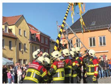
18:00 Uhr Maibaumsetzen auf dem Marktplatz 19:00 Uhr Live-Music mit Band „Stellplatz3“ im Anschluss „Disco Alarm“

Feiern Sie zwei Tage mit uns 160 Jahre Ortsfeuerwehr Hohenmölsen. Sie sind herzlich eingeladen.