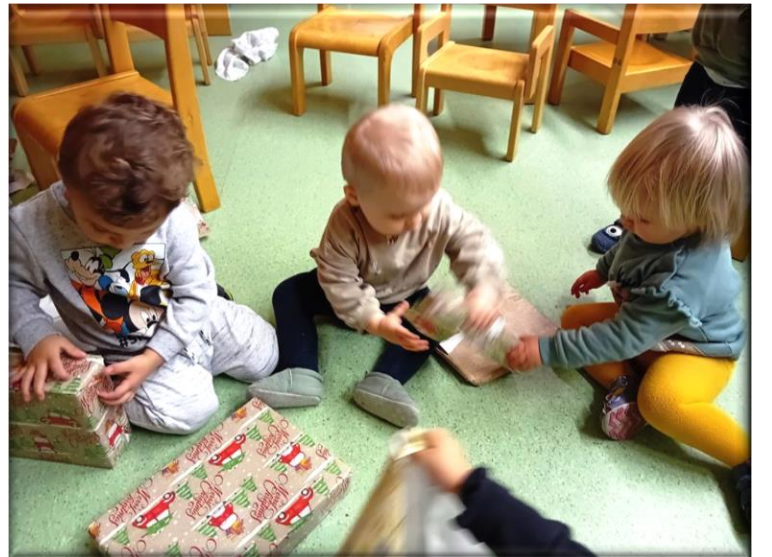
Inzwischen hatte der Weihnachtsmann schon den Gruppenraum der Grünschnäbel gefunden und auch seine Frau mitgebracht.