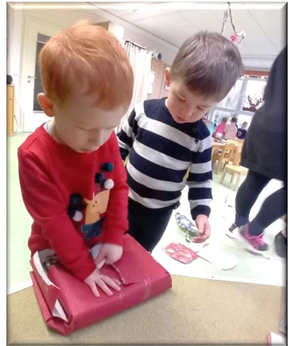
Der Weihnachtsmann hatte nicht nur Geschenke, sondern auch seine Frau mitgebracht. Sie beschenkte die kleinen Kükenkinder.