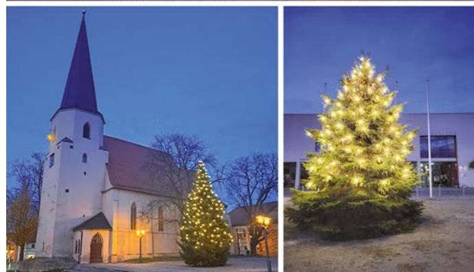
Fotos: Weihnachtsbaum Marktplatz, Weihnachtsbaum Altmarkt Weihnachtsbaum Platz des Bergmanns