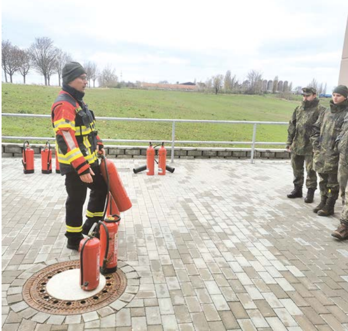
Praktischer Unterricht