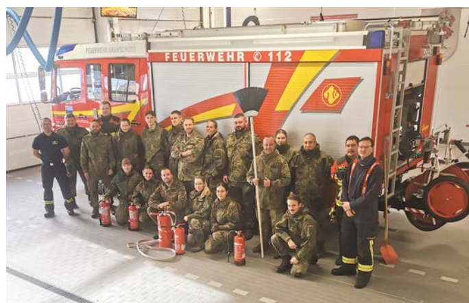
Feuerwehrmänner zusammen mit den Soldatinnen und Soldaten der Patenkompanie

Am 20. November 2024 führte die Freiwillige Feuerwehr Granschütz mit der Patenkompanie, der 3. Kompanie des Sanitätsregiment 1 aus Weißenfels, eine Brandschutzhelferausbildung durch.