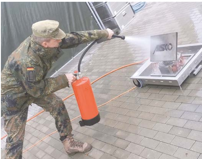
Einsatz eines Feuerlöschers, Foto: Wendt