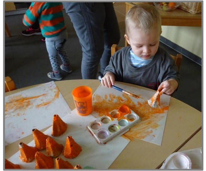
Im Mäusegruppenraum wurden Geschicklichkeitsspiele für alle Altersgruppen angeboten.