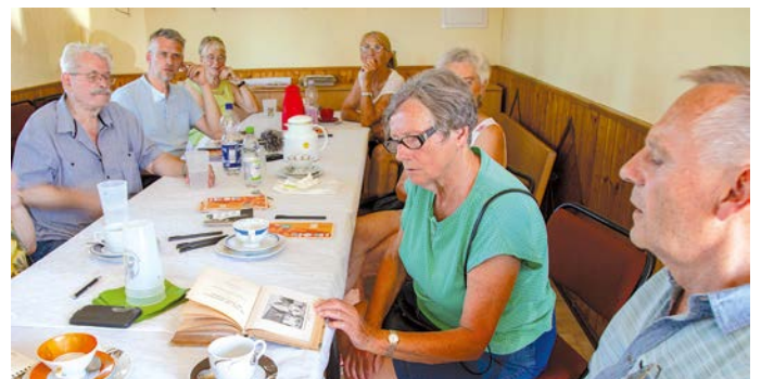
Erzählcafé am 16.08.2024 im Vereinsheim des Heimatvereins Keutschchen / Zembschen

Im Anschluss an das Lesecafé findet am Samstag, 26.10.2024 um 17:00 Uhr eine Abendandacht in der Kirche St. Georg statt. Dazu sind Sie herzlich eingeladen.